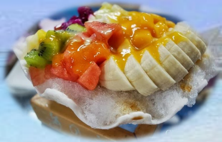
海之家貝殼海藻剉冰